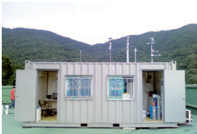
Messstation zur Luftqualitätsüberwachung: nebst anderen Analysengeräten wurde auch ein MARGA-System in diesen Container eingebaut, welches über längere Zeit vollständig automatisiert betrieben werden kann.

Die beschriebene Luftverschmutzung ist sicher ein Extrembeispiel, doch sollte man nicht vergessen, dass die gegenwärtige Luftverschmutzung nach wie vor gravierende Folgen für die Umwelt und unsere Gesundheit hat. Die Erforschung und das Verständnis der Einflüsse von Luftverschmutzung und Luftbestandteilen auf das Klima und unsere Gesundheit sind von grosser Bedeutung. Luftverschmutzung wird nicht allein durch gasförmige Verbindungen verursacht, sondern auch durch Aerosole und Schwebstoffteilchen (englisch: particulate matter, PM). Diese feinsten Partikel gelangen in die Lunge und schädigen sie; ultrafeine Partikel können sich von dort aus über die Blutkörperchen sogar im ganzen Körper verteilen und zu Entzündungssymptomen führen. Obwohl diese Risiken weltweit diskutiert und erforscht werden, ist immer noch nicht bekannt, welche Verbindungen genau zu Schädigungen führen. Somit besteht ein grosser Bedarf an spezifischeren Messdaten und Daten aus Langzeitmessungen. Schnelle Messmethoden und Echtzeitmessungen der Konzentrationen der chemischen Verbindungen in der Umgebungsluft sind ein Muss und sollen ein besseres Verständnis der Zusammenhänge ermöglichen.